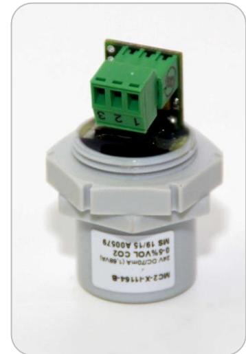
Wechsel-Sensoreinheit im Kunststoffgehäuse ohne Anschlusskabel