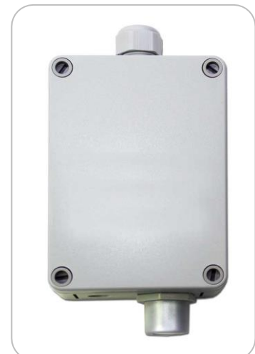
Option Gehäuse „A“ mit Sensoreinheit im Kunststoffgehäuse